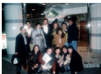
Gundi Thoma mit japanischen Fans 1991