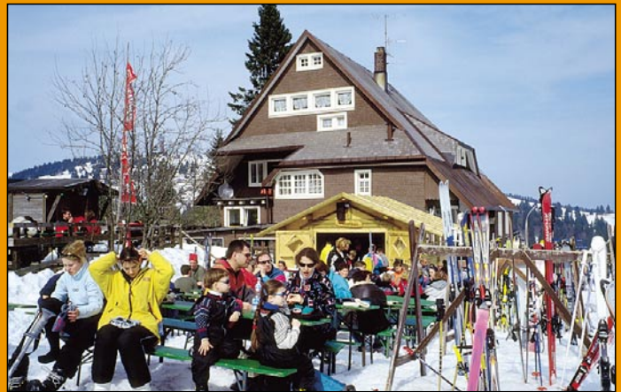
Skihütten laden Familien zur gemütlichen Rast

Das Schluchseehotel »Vier Jahreszeiten« bietet in den Ferienzeiten spezielle Kinderprogramme an. An fünf Wochentagen ist der »Spatzenclub« geöffnet. Für Kinder ab sechs heißt es täglich: Pool-Time! Zur »Spiel- und Spritzstunde« haben die Kids im Hallenbad des wellness-orientierten Komforthotels freie Bahn. Das Abendessen wird am Kindertisch serviert. So ist der Nachwuchs unter sich. Die Jugendlichen zwischen 14 und 18 Jahren treffen sich zum Piano Workshop, zur Showprobe, Küchenparty, Jugend-Dinner oder DJ-Workshop. Die Skischule kommt ins Hotel. Alle Anfängerkurse finden normalerweise am direkt beim Hotel gelegenen Übungslift statt. Für alle anderen ist der Transfer zum Pisten-Eldorado rund um den Feldberg organisiert, wo ab Dezember eine jedes Jahr wachsende Zahl moderner Schneekanonen die Freuden eines g'führigen Schnees garantieren. ■