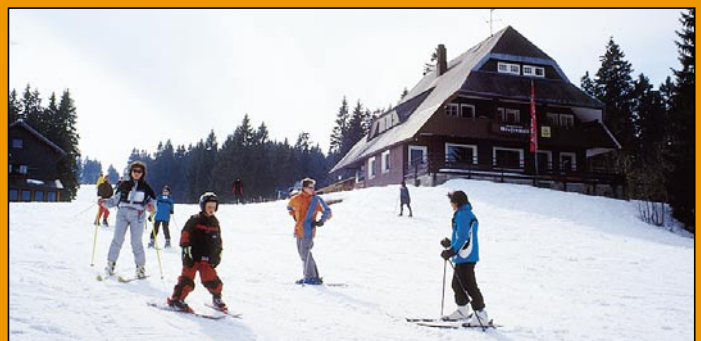
Kindgerechte Hänge bieten auch dem Nachwuchs Pistenspaß