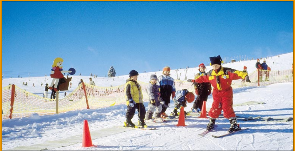
Kinderbetreuung am Feldberg

Sehr beliebt sind die regelmäßig durchgeführten Familien-Rodel-Wanderungen, bei denen Klein und Groß eine erkundungsreiche Runde um Todtnauberg drehen. Eine Riesengaudi für die Kinder sind die romantischen Laternen-Wanderungen. Für eine passende Stärkung ist gesorgt: Vor kalten Fingern schützt den Nachwuchs der bereitgehaltene warme Kakao, während bei den Großen heißer Glühwein für beste Stimmung sorgt. Neben einer Reihe klassifizierter, kinderfreundlicher Häuser im verkehrberuhigten Bereich, die über kindgerechte Ausstattungen, wie Spielzimmer, Spielgeräte und Schlittenausleihe verfügen, gibt es in Todtnauberg ein Familienhotel mit Babyservice für die aller kleinsten Gäste. Das Hotel Engel bietet ne-