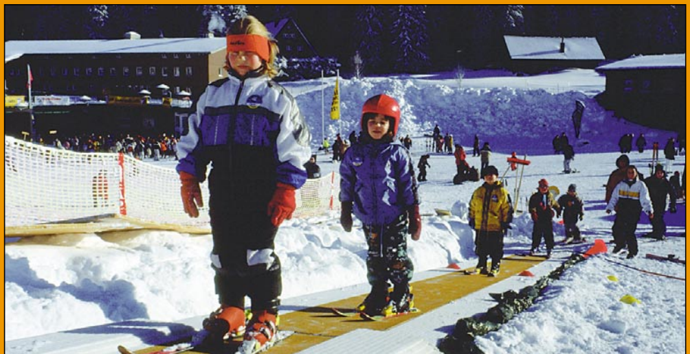
Mit dem Zauberteppich geht's bergauf