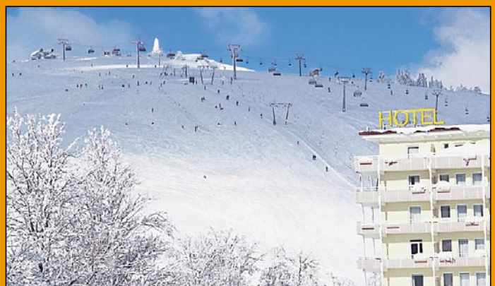
Vom Feldberger Hof aus sind es nur ein paar Meter bis zum Pisteneinstieg