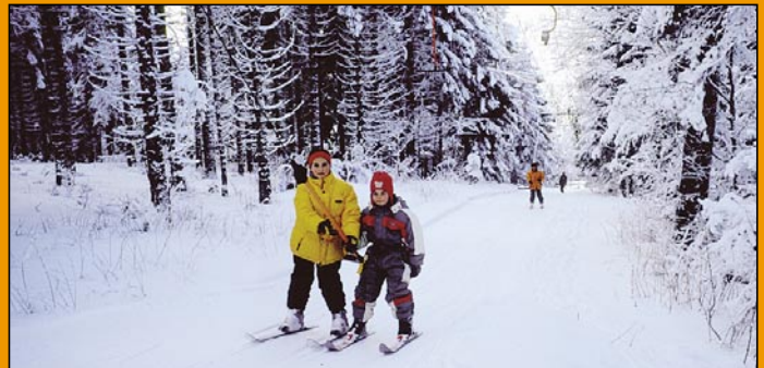
Dank hilfreichem Liftpersonal kommen auch kleine Skifahrer prima hinauf