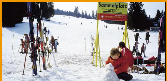
Kleiner Schneemann am Pistenrand