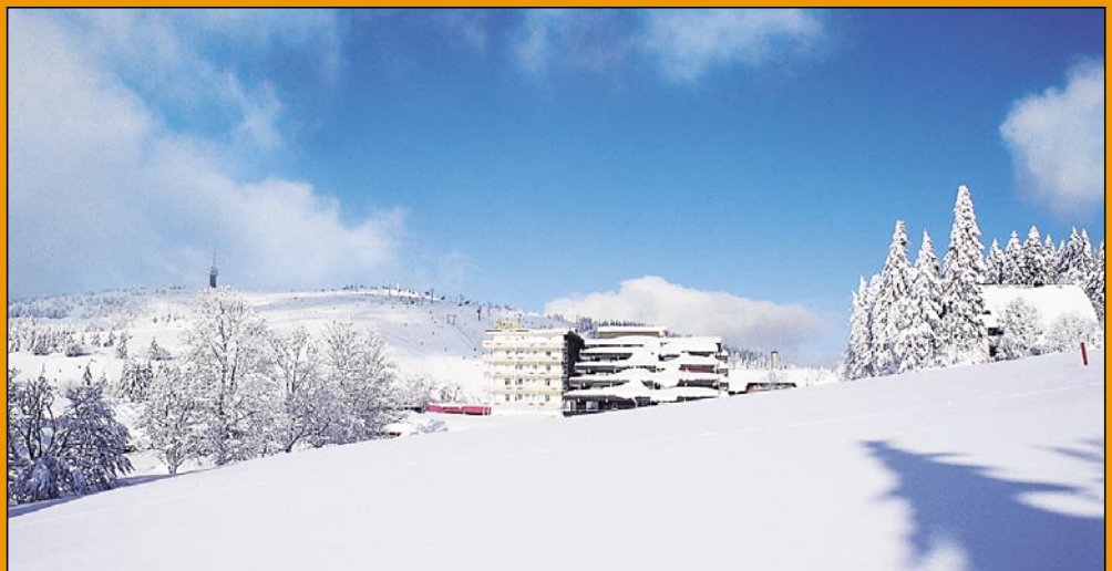
Im Hochschwarzwald zeigt sich der Winter von seiner schönsten Seite